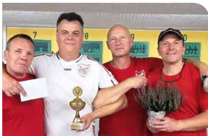
3. Platz im ersten Punktspiel: die SVG-Kegler