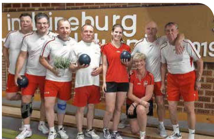
4. Platz für unsere Kegler beim Heideturnier