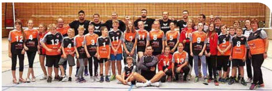
Unser Volleyballnachwuchs zu Gast bei den BR Volleys