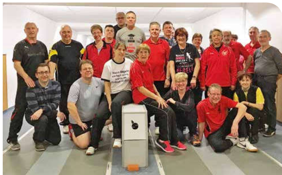
Trainingslager Osterburg 2019

Für die erste Männermannschaft stand am 12. Januar das Auswärtsturnier in Brieselang auf dem Plan. Dieses konnten wir mit dem zweiten Platz hinter den Gastgebern erfolgreich gestalten. Somit ergibt sich für die nächsten beiden Turniere folgende Konstellation. Der SVG führt als Aufsteiger die Tabelle mit 19 Punkten